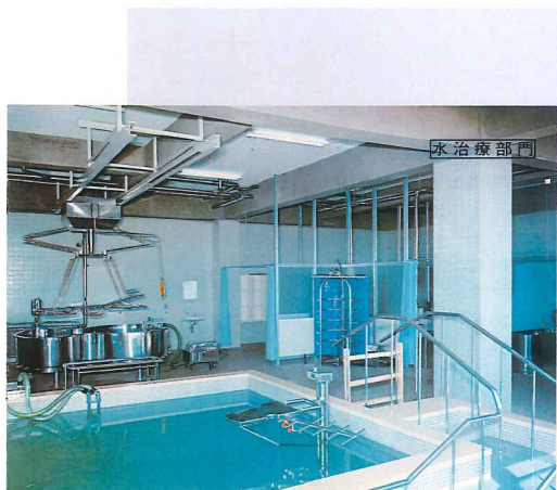
(写真2 温泉を使用した水治療室)

当時最先端のリハビリ治療機器である水治療装置や歩行用プール(写真2)なども導入されました。そのころは理学療法士という国家資格が誕生して間もなく、リハビリテーションという言葉も社会的に認知されつつありました。亥十二会長が他の医療機関にさきがけて、この地の温泉を利用したりリハビリ治療を行いたいという熱意