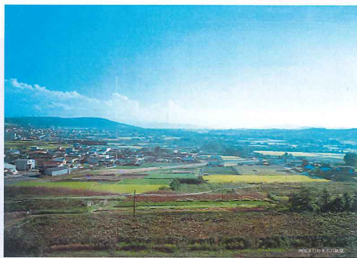
(写真1 創立時の病院からの風景)

熊本県初のリハビリ専門病院として注目度は高かったようです。当時この地はまだ飽託郡で、周囲にはブドウ畑が広がっており、パンフレットには「小高い丘からは南に金峰、眼前に熊本市街、遠くに熊本城の櫓(やぐら)が見えます。左手に龍田山が東に延びて、そのはずれに大津街道の杉並木も見えます。その遙か彼方に阿蘇外輪山が霞んでおります。春には雲雀(ひばり)が囀り、夏には自然の冷風が心地良く、秋には紅葉が眼を楽しませてくれます。」と紹介されています。(写真1)