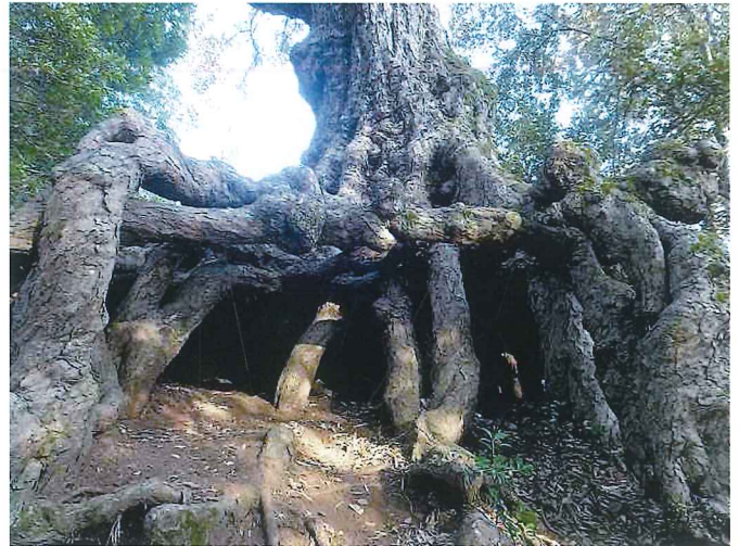
(小さな子どもを連れてゆくと喜びますよ)

流されて露出した根が、太い幹を支えるために肥大化して絡まって、まるでジャングルジムか秘密基地のような姿となっているのです。中に入ると子どもが立てるほどの空間ができており、まさに神が宿っているかのようです。そこはかつて神社のあった場所で、集落ではこの樹を「天神さん」と呼んで大切にしているのです。