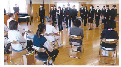
新入社員代表 挨拶の様子