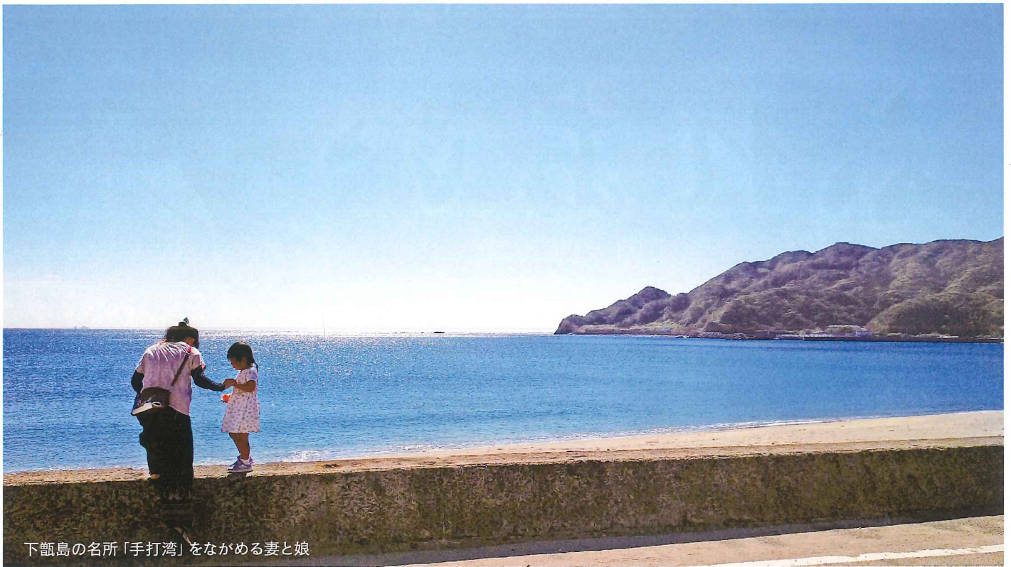
下甌島の名所「手打湾」をながめる妻と娘