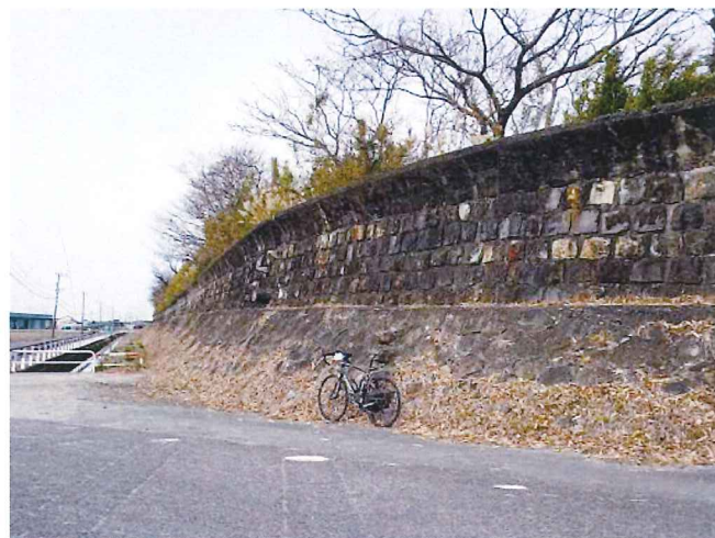
(万里の長城を彷彿とさせる石積みの「明丑堤防」)

ところで、「丑」という字には「からむ」という意味があり、芽が種子の中で伸びることができない状態を表しているとか。そのため丑年は「我慢(耐える)」や「発展の前振れ(芽が出る)」を表す年になると言われているそうです。今年はそんな一年になりそうですね。