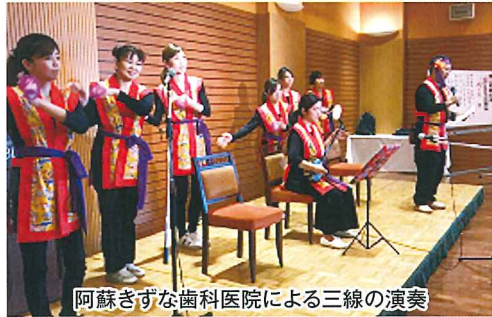
阿蘇きずな歯科医院による三線の演奏