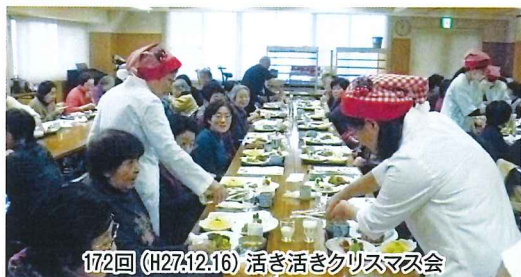
172回(H27.12.16)活き活きクリスマス会