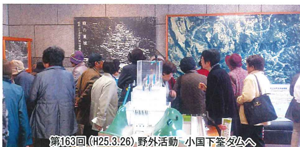
第163回(H25.3.26)野外活動 小国下釜ダムへ