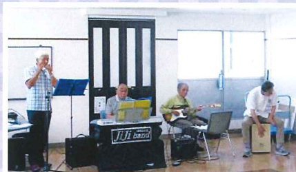
6/13 JIJI BAND 講演 室原院長も飛び入り参加!