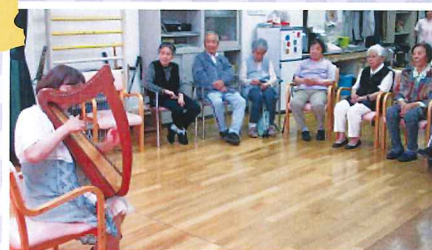
6/1 ハープの演奏会 デイケアにて