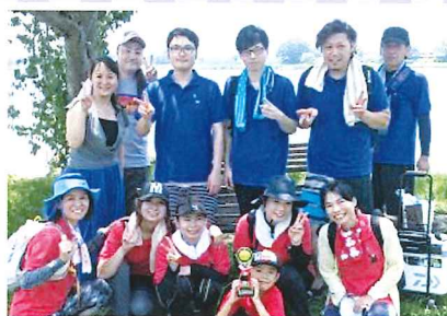
7/16 火の国レガッタ 女性チーム準優勝!