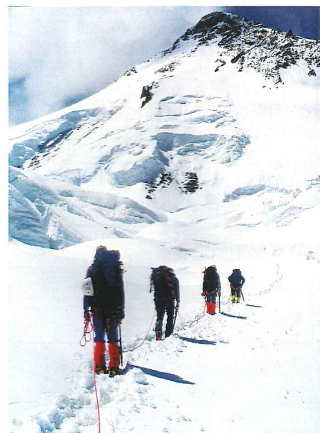
BCからCIへの荷上げ 正面にスキルブルムを望む

スパンティーク登頂後、更に高い山に登りたいという気持ちが強くなりました。神奈川ヒマラヤクラブでは次の登山に向けて幾つかのプランが検討されました。1996年、スキルブルム峰(7360m)が候補として挙げられました。この山は、カラコルム山脈のほぼ中央に位置し、中国とパキスタンの国境上にあります。1977年の日本山岳協会K2登山隊の主要メンバーと神奈川県高体連の先生達との混成チームです。日本を代表するベテランクライマーと同じ登山隊に参加できるということで迷わず参加を申し出ました。隊員の多くが高校の教員であり、50~60才台が約半数を占めることから、登山のテーマは「高校生に夢を、中高年に素晴らしさを!」とされました。夢を持たないといわれる高校生に、教員自らが夢を抱いてヒマラヤ登山に立ち向かうことで、「夢は自ら育むもの」というメッセージを発信する。更に、登山が生涯スポーツとして適しており、トレーニング方法によっては、中高年の一般登山者でもヒマラヤ登山の素晴らしさを体験できることをアピールする、というものです。1997年7月の登山に向けて本格的な準備に入りました。医薬品や器材の準備/調達とトレーニングです。週に2~3回は近くの山に登り(週日は夕方から夜にかけて)、毎日病院の自転車エルゴメーターやトレッドミルで汗を流しました。脚力をつけるためにエルゴメーターは最大負荷量を200Wから始めて250Wまで上げました。ヒマラヤ登山という目標があり、毎日が充実した楽しい日々でしたが思わぬ落とし穴が待っていました。オーバートレーニングです。5月のはじめ膝が腫れてきました。痛みが無かったのでトレーニングを続けていたら突然激痛が出てきて歩けなくなったのです。整形外科に相談したところ変形性膝関節症、つまり老化現象で関節の軟骨が摩耗した状態です。とりあえずは安静が必要で登山などもっての外とのことでした。根本的な治療法は無く、炎症が治まったら関節の負担を軽減するために膝関節の周りの筋肉を鍛えるくらいしか方法はないとの事でした。大きな希望が絶望に代わってしまいました。こうして登山隊への参加は諦めざるを得なくなったのです。