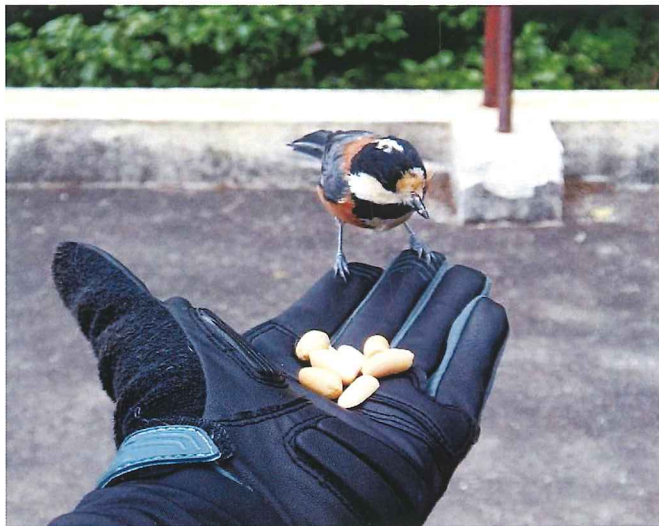
ヤマガラはシャッター音が嫌いなので撮影時はご用心!

ていると、スーッと手のひらに乗ってきてピーナツをついばんで飛んでいきます。ヤマガラの、その僅かな重みにハッとときめきながら、野生の生き物との一瞬の触れ合いを愉しむことができ、坂を上ってきた疲れも吹っ飛んでしまうのです。