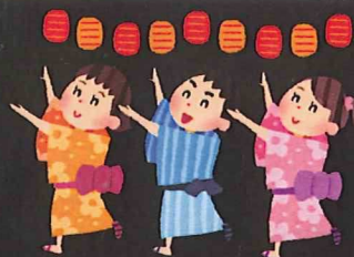
イラスト選定 小中 幸樹