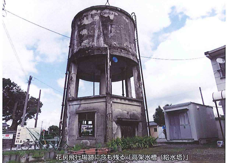
花房飛行場跡に今も残る「高架水槽(給水塔)」

ると、その「70年」という時の流れを感じずにはいられません。後世のためにもこのような戦争遺産を大切に保存してもらいたいと思います。