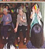
地域の保育園児の皆さんと歌や手遊びを楽しみました。