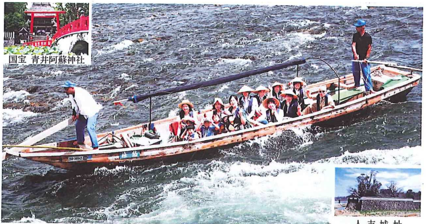
国宝 青井阿蘇神社

川下りの後は温泉に入って美味しい鮎料理を頂き、ほろ酔い気分の織月酒造を後にし、旅の最後は球泉洞。夏の人吉を満喫した1日でした。先生有難うございました。