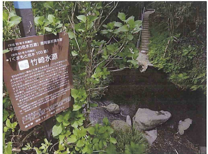
わたしの好きな竹崎水源

ただし、美味しいからと言っても湧水の飲み過ぎにはご注意を。公衆トイレは途中に数箇所しかありませんから・・・。