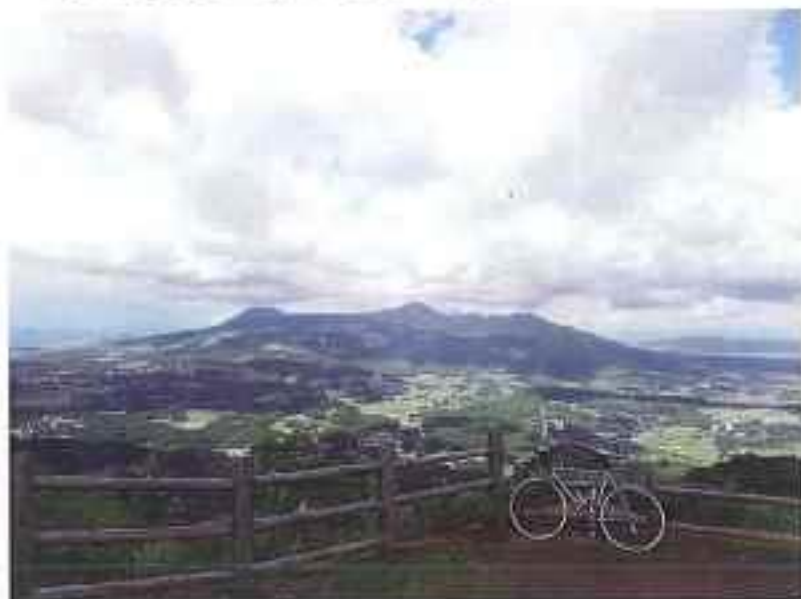
俵山峠の展望所から阿蘇の中央火口丘を望む

俵山峠から一気に南郷谷に下った後も色んな「旧道」を走ると車の姿をほとんど見ることなく南阿蘇のあちこちを廻ることができるのです。