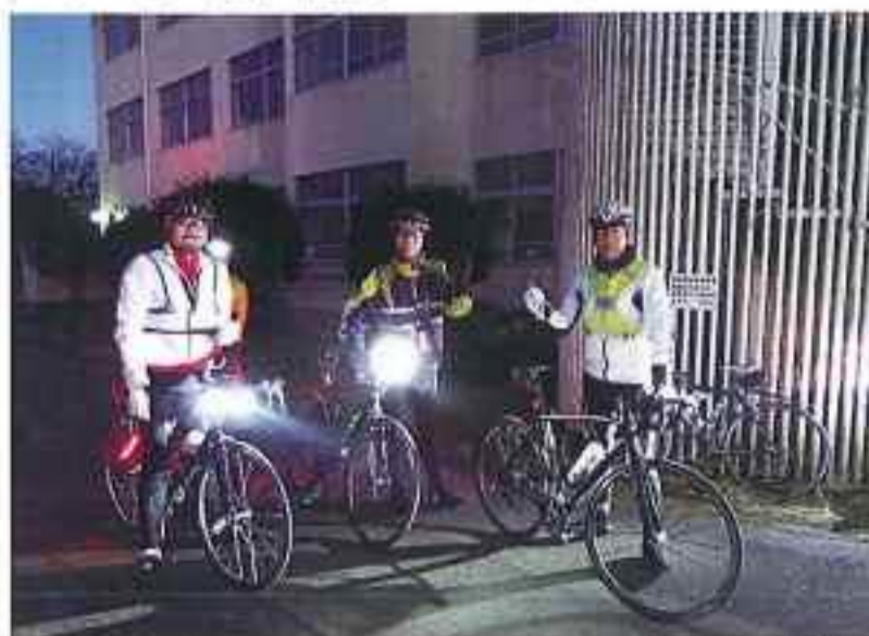
200km 走ってゴール後、一緒に走った自転車仲間と記念撮影

て南関まで行って折り返し、金峰山の頂上まで登り、それから宇土半島を一周して、松橋から甲佐へ行き、益城を通して光の森に帰ってくるのです。これを13時間半以内（平均時速15km）で帰ってくれば認定のメダルがもらえるのです。自転車仲間と一緒に走り、約10時間で帰ってきて、見事、認定のメダルをもらうことができました。