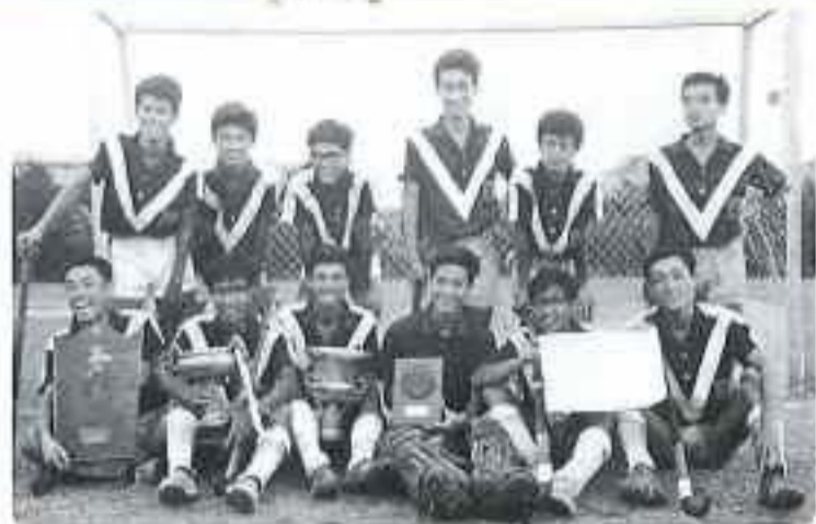
国立6大学リーグ戦（ホッケー）で優勝 九州大学イレブン 前列左より2人目が筆者 昭和41年8月 東京大学検見川グラウンド

最大の目標は、旧七帝大戦（ホッケーは国立六大学戦）で優勝することでした。シーズンオフの冬もトレーニングを続け基礎体力を養成しました。5年生（医